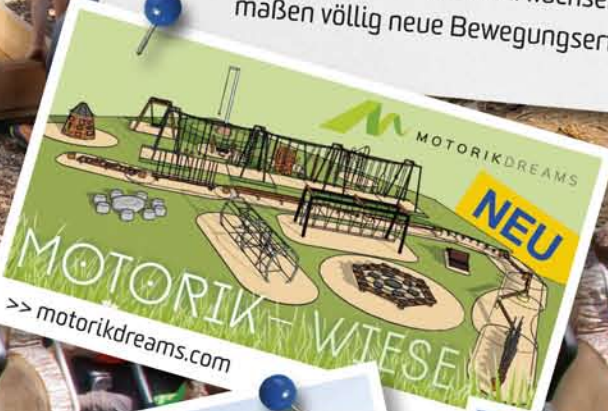
MOTORIK-WIESE >> motorikdreams.com